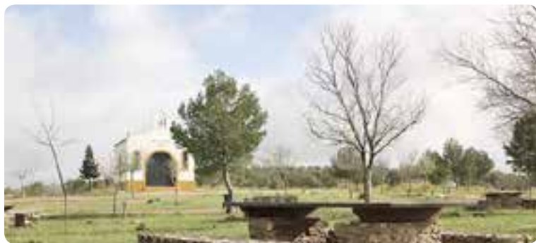
Ermita de la Virgen del Rosario, El Rubio.

Entre sus edificaciones de interés histórico-artístico destacan la iglesia de Nuestra Señora del Rosario y la ermita de la Virgen del Rosario en el Cerro de la Cabeza.