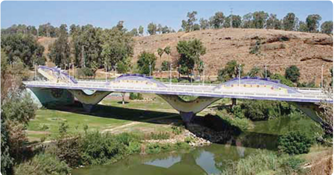
Puente del Dragón, Alcalá de Guadaíra.

Abandonamos este municipio siguiendo un camino muy transitado que nos lleva hasta la Balsa de Melendo , bordeándola y a partir de ahí seguiremos la canal que nos acompañará en gran parte del camino. Una vez abandonada la canal nos encontraremos con una zona de tierras bajas y fácilmente inundables en épocas de lluvia que podrían dificultarnos el tránsito. En este punto nos sirve de referencia unos establos abandonados a los que tenemos que llegar para poder seguir la ruta. Pasada esta zona cruzaremos el paso elevado