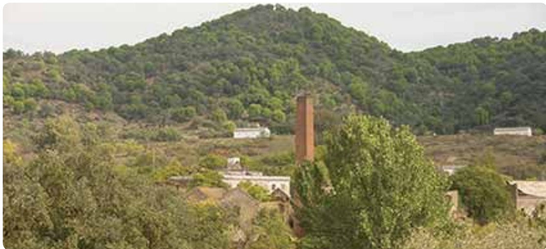
La Fundación, El Pedroso.

En la villa minera cruzamos la riera del Huéznar por el caserío de Guadalquivir hacia el cordel de El Pedroso. Pasaremos por el apeadero de Las Arenillas, las ruinas del apeadero de Ventas Quemadas, la casa de la Mina y el cortijo del Puerto del Cid hasta el cordel de