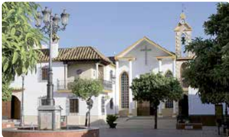
Iglesia parroquial de Santa Ana en la plaza del mismo nombre.