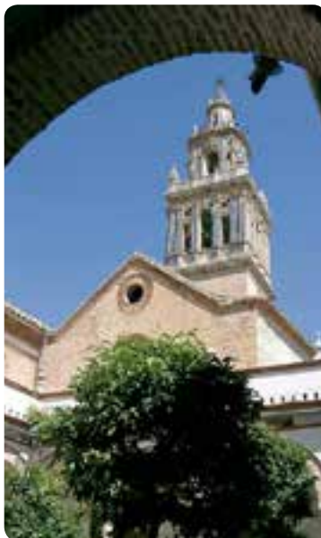
Iglesia de Santa María, Écija.