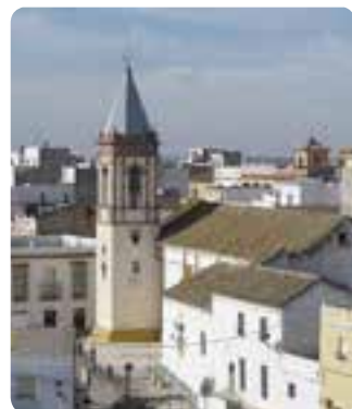
Iglesia de Santa Marta, Los Molares.