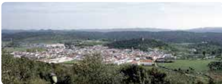
Alanís desde el Cerro de los Guindales