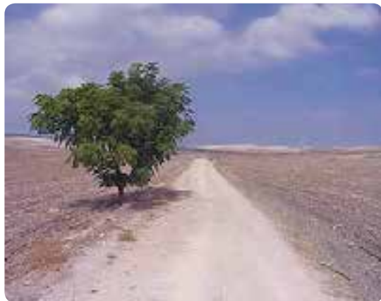
Partiendo de El Coronil.

En Coripe llegamos a la plaza de San Pedro con la iglesia del mismo nombre, donde se recibe el sello para la credencial de peregrino. Pronto la antigua calle se hace un camino de tierra, atravesaremos el arroyo del Boquinete, tras el cual, el camino vira a la derecha y asciende. En algunos puntos, puede ser rocoso y pedregoso. Poco después volveremos a descender, y atravesamos el arroyo de Gilete que transcurre sobre el Camino, se vuelve a subir, pierde de nuevo altura y se encuentra con la carretera, seguimos a la izquierda hasta un cruce, tomamos a la derecha el cordel de Morón y Algodonales que nos lleva entre alambradas algo más de un kilómetro hasta que a nuestra izquierda sale un sendero que nos dirigirá hasta el cortijo de la Fuensolana, una vez allí tomaremos dirección norte para llegar a una confluencia de caminos. El que hemos de tomar es el menos perceptible, y gira a nuestra derecha por un valle ancho donde el trayecto gana altura. Una vista atrás en el paisaje con colinas y montañas merece la pena. Cuando hemos llegado arriba continuamos a la izquierda hasta un edificio, allí comienza a la izquierda un camino vecinal, llegando por un carril al arroyo de la Mujer. Lo seguimos a la izquierda, que se convierte en un claro camino del trayecto ancho. Más adelante el trayecto se hace de nuevo plano,