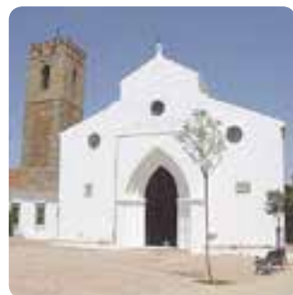
Iglesia de Santa María del Águila, Alcalá de Guadaíra.