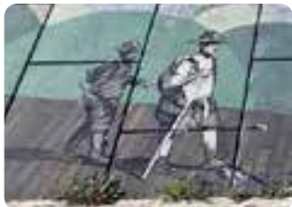
Mural de despedida en Sevilla.