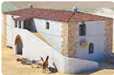
Recreación de La Almona.

Para terminar este camino de la Frontera por la provincia de Sevilla llegamos a Guadalcanal, nombre que procede del topónimo árabe «Guad-Al-Kanal». Aquí se asentó la Orden de Santiago en La Almona . Otros edificios visible son las iglesias de Santa María de la Asunción , de la Concepción y la de Santa Ana (actual Centro de Interpretación y Recursos); las ermitas de Guaditoca, San Benito y del Cristo del Humilladero . Este municipio es de gran tradición ceramista.