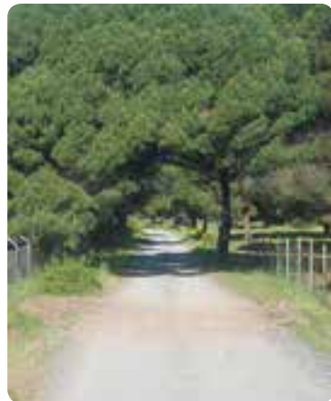
Entrando en la Sierra Norte.

De su legado artístico, cabe destacar la iglesia de Nuestra Señora de la Consolación , construida sobre un torreón romano y una fortaleza árabe; las ermitas de la Virgen del Espino y la del Cristo de la Misericordia y Nuestra Señora de los Dolores ; la Cruz del Humilladero ; la Cartuja de San Bruno (la Casa Granja).