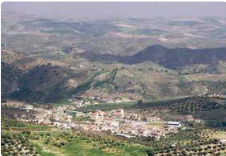
Vista general de Algámitas.