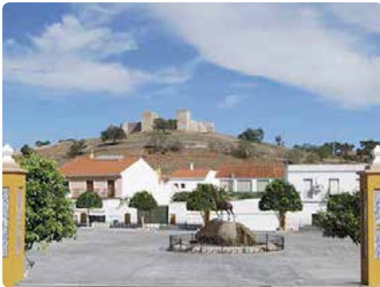
Plaza de Andalucía, al fondo el castillo, El Real de la Jara.