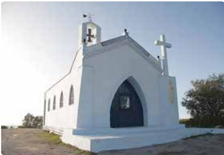
Ermita de la Pura y Limpia Concepción, Pruna.