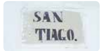
Antiguo rótulo del callejero santiaguista.

Durante la dominación árabe, constatamos que pervive la comunicación viaria entre todos estos territorios, de la que se hacen eco los geógrafos árabes y otros viajeros. Reconquistada Niebla en 1260, el Rey Sabio jugó un trascendental papel en la administración y repoblación del territorio. En los sucesivos repartimientos, casi todo el oeste de España 3 iba a conformar un a modo de limes Sancti Jacobi , que, en algunos lugares, iba a persistir hasta finales del siglo XIX 4 . Las numerosas encomiendas santiaguistas que jalonan la provincias de Sevilla, nos llevan a proponer una RUTA JACOBEOA, que recupera parte del viario, que era recorrido por los peregrinos con dirección a Santiago y que, a la inversa, por los Visitadores de la Orden santiaguista 5 .