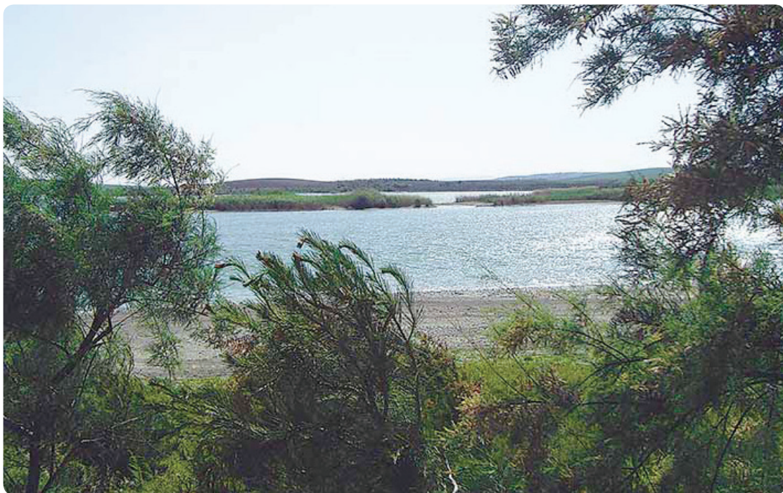
Balsa de Melendo, Lebrija.

Este camino se incorpora a la provincia sevillana en la población de El Cuervo, localidad, que como todos sabemos, es límite de ambas provincias. Hemos dejado atrás los viñedos jerezanos pero no totalmente ya que la incorporación a la localidad la hacemos bordeando los viñedos de la finca Santa Lucía. Nos dirigiremos a continuación a la ermita de Nuestra Señora del Rosario y desde allí entraremos en la localidad de El Cuervo de Sevilla . Atravesaremos por su avenida principal, que coincide con la N-IV, y paralelamente a esta carretera dirección Sevilla tomaremos en la intersección del pueblo un camino a la izquierda cruzando la carretera nacional, llamado camino de las Monjas , hasta encontrar una senda que sale a nuestra derecha, un poco más adelante daremos un leve giro a la derecha posteriormente a la izquierda y al final giraremos de nuevo a la derecha,