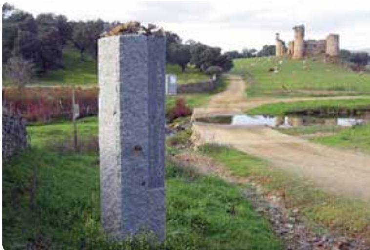
Vista del arroyo de la Vibora, límite entre Andalucía y Extremadura, y el castillo de las Torres.

Varios nuevos miliarios han sido colocados estratégicamente en cada término local, llevados a cabo conjuntamente por la Asociación de Amigos del Camino de Santiago Vía de la Plata con la Diputación de Sevilla.