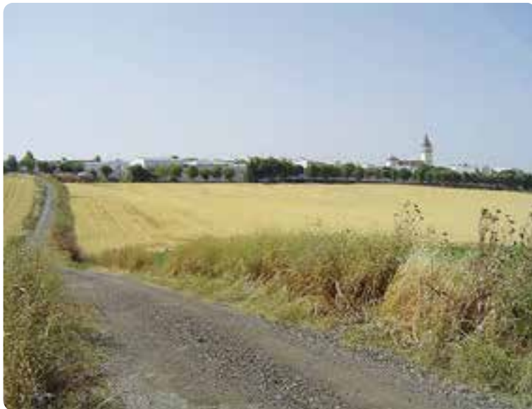
Entrando en El Coronil.

Abandonamos la Sierra Sur para enfilar el camino hacia la Campiña que nos llevará a Los Molares.