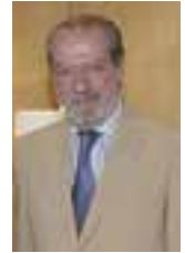
Fernando Rodríguez Villalobos Presidente de la Diputación de Sevilla