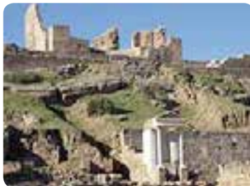
Conjunto arqueológico Mulva-Munigua.

Un poco más al norte, a orillas de la ribera del Huéznar, se asentaron íberos y romanos en Munigua , hoy Villanueva del Río y Minas. En los alrededores, la belleza de su paisaje de arroyos y veredas alivian el camino. La población aparece entre cultivos de algodón, maíz y olivares. Su acervo está representado por las iglesias de Santiago (con un artesonado mudéjar original) y de San Fernando , y, sobretudo, por el castillo de Mulva , donde encontramos la «Casa Atrium», única en España por su forma trapezoidal. Destacan también el Conjunto Histórico Minas de la Reunión .