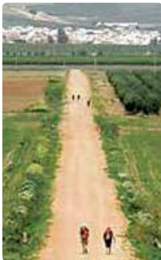
Entrando en Guillena.

Cuando los romanos conquistaron Hispania, al mismo tiempo que expoliaban la gran riqueza minera de sus canteras, fueron desarrollando una compleja red de calzadas para unir sus principales ciudades. Una de estas calzadas, la Vía Augusta, la Ruta de la Plata, atravesaba esta comarca, en la zona noroccidental de la provincia de Sevilla, comunicando la Bética con la Lusitania.