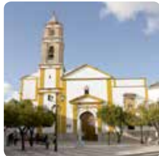
Iglesia parroquial de San Marcos.

Su principal monumento es la iglesia parroquial de San Marcos (con un interesante retablo barroco), pero también es de interés la ermita de San José en Navarredonda, la Fuente del Moro en la aldea la Mezquitilla, la hacienda de San Pedro , el yacimiento ibero-romano de los Baldíos .