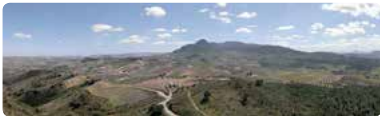
Vista de la Sierra Sur sevillana.