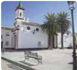
Iglesia de San Pedro Apóstol, Coripe.