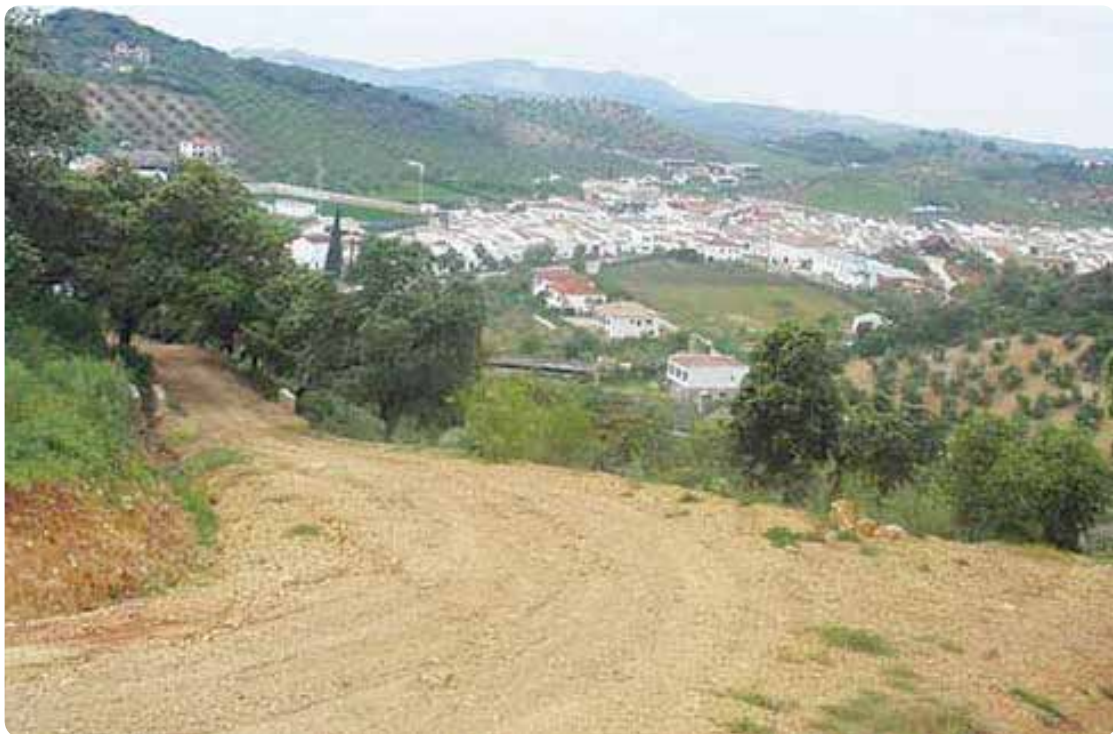
El Camino entrando en Coripe.

Sirva este proyecto caminero, peregrino y espiritual –que si bien, como ruta santiaguista, podría considerarse como innovadora– para la recuperación de un viejo itinerario que fue eje vertebrador del Sudeste sevillano.