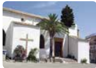
Iglesia del Dulce Nombre de Jesús.