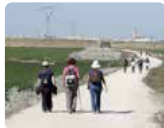
De Las Cabezas de San Juan a Utrera.