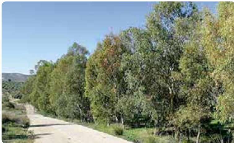
Entorno Sierra Sur-La Campiña.