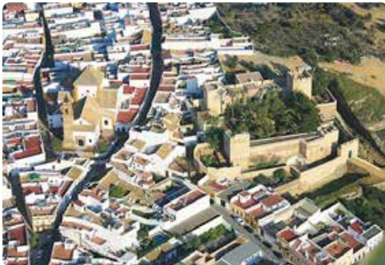
Vista aérea de Mairena del Alcor.