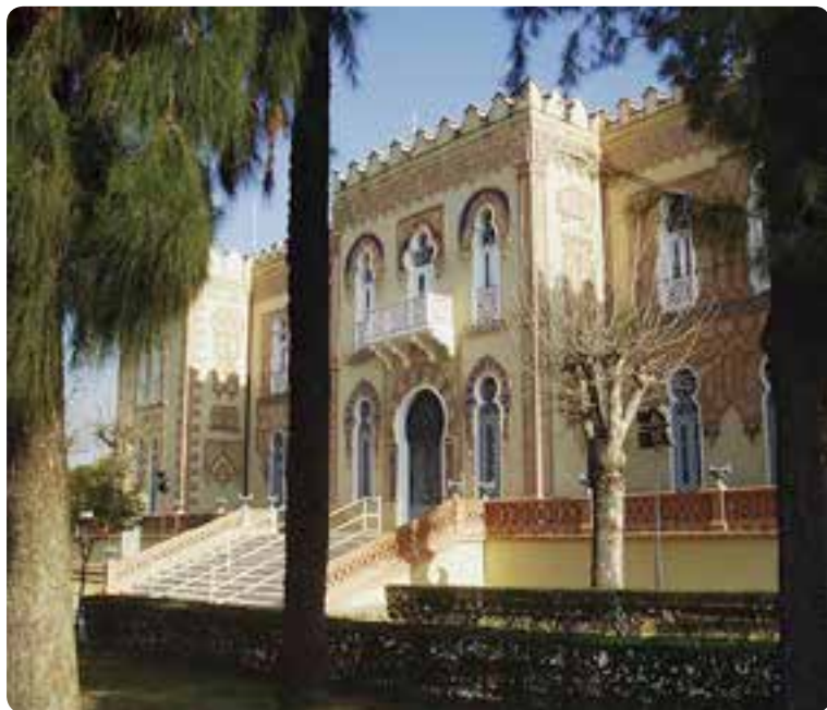
Palacio Alpérez, Dos Hermanas.