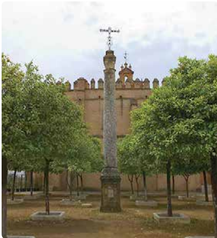
Monasterio de San Isidoro del Campo, Santiponce.

Dejamos Itálica a nuestra izquierda y de vuelta a la senda, una larga recta nos llevará entre trigales y olivos hasta Guillena.