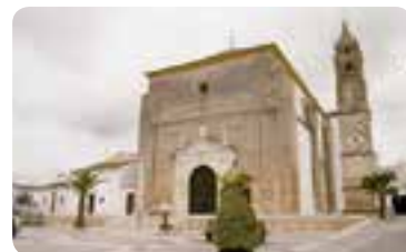
Iglesia parroquial de San Sebastián.