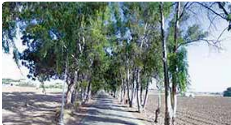
De Estepa a El Rubio.