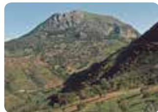
El Terril, Sierra del Tablón (Algámitas).