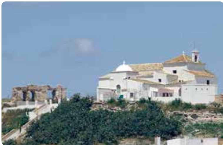
Ruinas del castillo y ermita de Santa María del Castillo, Lebrija.

Una vez atravesados los extensos campos de cultivo podremos disfrutar de distintos monumentos arquitectónicos como la iglesia parroquial Santa María de la Oliva , de estilo gótico-renacentista, con su torre similar a la giralda; el convento de San Francisco ; y la ermita del Castillo .