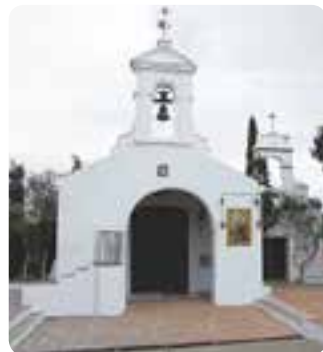
Ermita de San Benito, Castilblanco de los Arroyos.