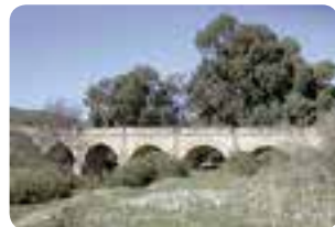
Puente «De los seis ojos».

Entre sus edificaciones de interés destacan la iglesia parroquial de San Juan Bautista y los puentes «De los seis ojos» y de la Solana .