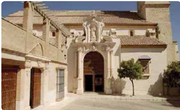
Iglesia de San Sebastián, Estepa.