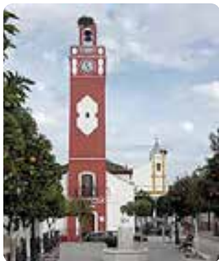
Torre del Reloj, Almadén de la Plata.