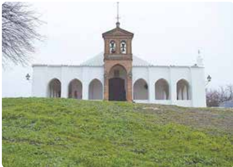
Ermita de Setefilla, Lora del Río.

Aparte de ser popular su artesanía de forjado y alfarería, cuenta con un vasto patrimonio histórico y cultural. En un paseo por sus calles asombran los balcones y fachadas de edificaciones señoriales, como el del Ayuntamiento , la Casa de la Virgen o la de los Leones ; sus plazas; y el bellissimo campanario de la iglesia mudéjar de la Asunción que destaca por sus portadas de ladrillo con baquetones y escudos, y por su orfebrería. Merecida mención tiene la iglesia de Jesús Nazareno , el convento de la Inmaculada ; y la ermita de Setefilla que acoge en septiembre una multitudinaria romería.