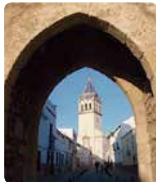
Iglesia de Ntra. Sra. de Consolación.